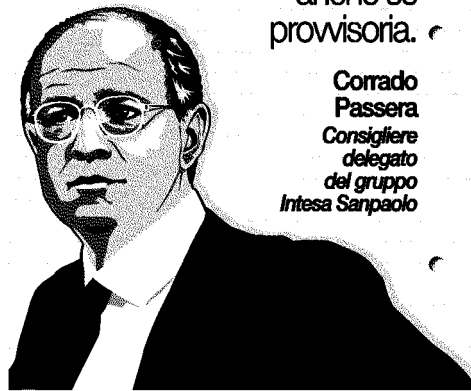
Corrado Passera Consigliere delegato del gruppo Intesa Sanpaolo

La sottorappresentanza femminile nei consigli di amministrazione in Italia è talmente clamorosa che dovremmo usare una misura drastica, anche se provvisoria.